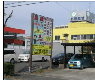
南側道路からの写真