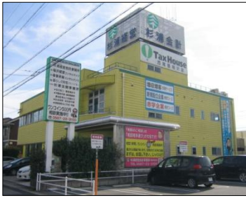
北側道路からの写真 (事務所入り口はこちら)